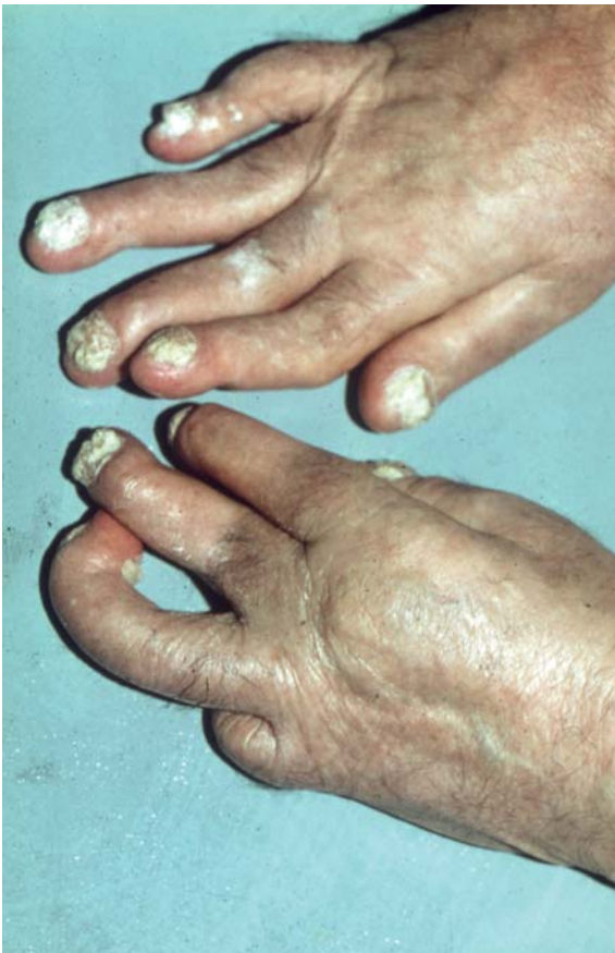
Psoriasis-Arthritis mit einer Psoriasis der Nägel

antirheumatische Basistherapie wird seit vielen Jahren auch Methotrexat (MTX) eingesetzt, das auch auf die psoriatische Haut einen günstigen Effekt hat. Qualitativ hochwertige Studien, die eine gute Wirksamkeit des MTX bei Psoriasis-Arthritis belegen, liegen nicht vor. Leflunomid kann alleine oder in Kombination mit MTX eingesetzt werden. Deutlich wirksamer, als alle bisher eingesetzten Therapien, sind für die Behandlung der Psoriasis-Arthritis zugelassene Biologika und Biosimilars, die zu Lasten der Gesetzlichen Krankversicherung verordnet werden dürfen, wenn andere