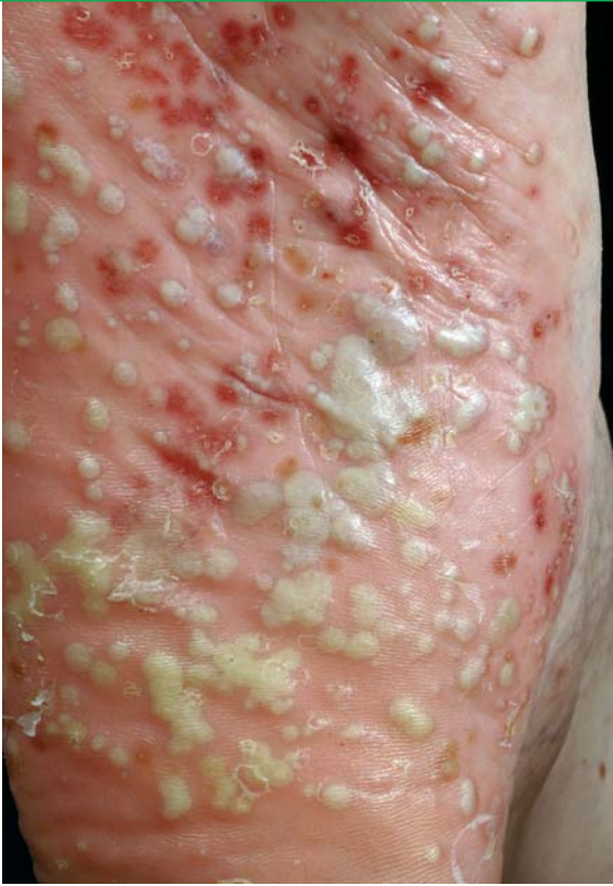
Palmo- plantare Pustulose an der Fußsohle

Eine Sonderform ist die über den ganzen Körper verteilte pustulöse Psoriasis (Psoriasis pustulosa generalisata). Diese Form gehört, wie die psoriatische Erythrodermie, zu den schwersten psoriatischen Erkrankungen. Es zeigen sich sehr schnell, innerhalb von Stunden, viele Pusteln auf entzündlich geröteter Haut. Die Pusteln sind großflächig über den ganzen Körper verteilt (generalisiert). Die meisten Patienten mit generalisierter pustulöser Psoriasis hatten vorher keine Plaque-Psoriasis als Grunderkrankung. Erkrankte sind im Allgemeinbefinden in der Regel stark beeinträchtigt, haben Fieber und fühlen sich abgeschlagen. Die Behandlung muss stationär in einer Hautklinik erfolgen. Die Therapie ist eine Kombination von innerlichen und äußerlichen Medikamenten. Bei den Pustel-bildenden Formen der Psoriasis sollte Dithranol nicht verwendet werden.