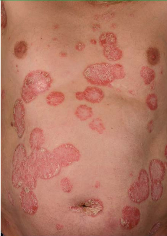
Typisches Bild einer Psoriasis vulgaris